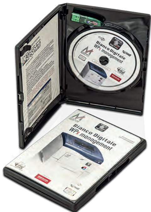
BiancoDigitale® WPs management