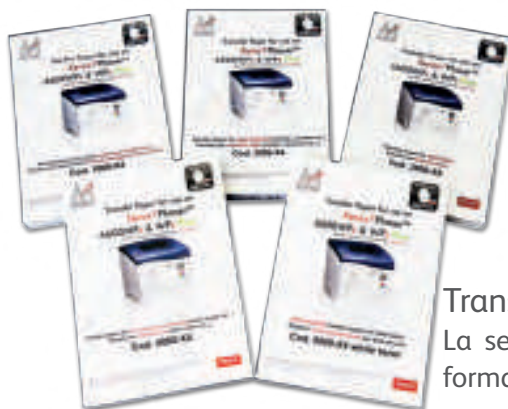
Transfer A4 serie X4 La serie X3 identifica il formato grande A3