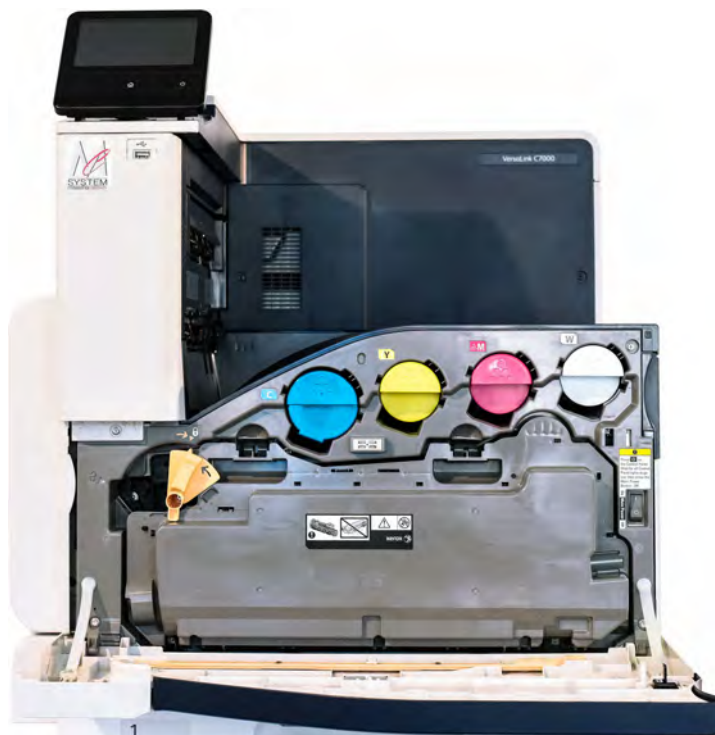
Toner Cartridge CYMW Ciano Giallo Magenta Bianco