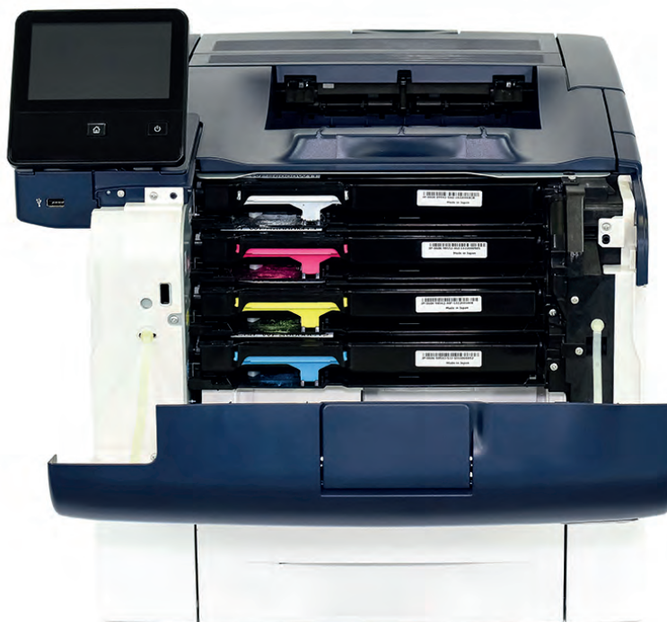
Toner Cartridge WMYC Bianco Magenta Giallo Ciano Fluorescenti