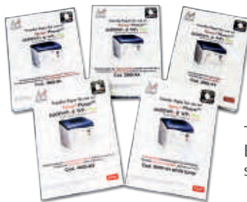
Transfer BiancoDigitale series X4

La stampante C400WPs-fluo BiancoDigitale, allarga la famiglia di prodotti a toner bianco per stampa su supporti di tipo transfer. L'innovativa tecnologia, con il plus dei toner fluorescenti, permette di produrre oggetti personalizzati con immagini che richiedono l'uso del bianco e che acquisiranno in più la caratteristica di illuminarsi di luce propria se sottoposti a luce di wood (luce nera). I caratteristici toner utilizzati, permetteranno inoltre di riprodurre, anche in presenza di luce normale, colori brillanti e luminosi altrimenti impossibili da realizzare con la quadricromia tradizionale. Con gli esclusivi transfer per toner bianco sarà possibile creare personalizzazioni su tessuti naturali e sintetici o materiali, anche rigidi, di vario genere.